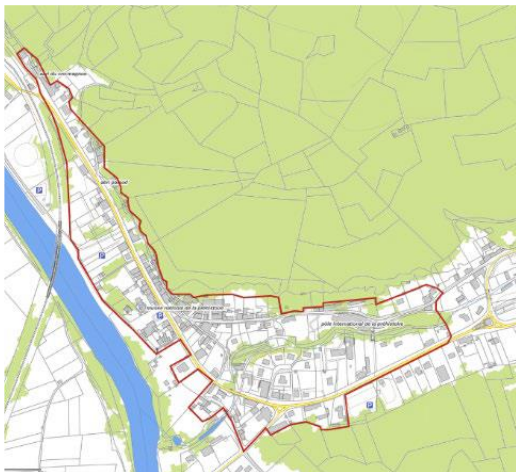
CARTE LES EYZIES