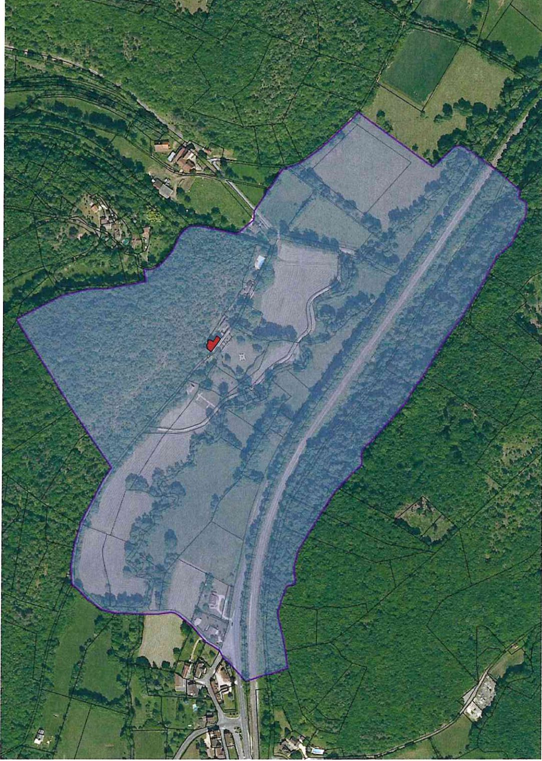
Annexe 1/1 Plan du Périmètre Délimité des Abords du manoir de Roucaudou sur la commune de Les Eyzies (Manaurie)