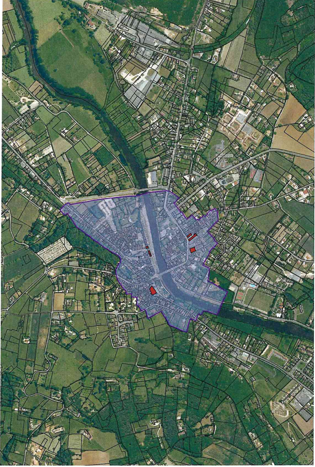
Annexe 1/1 Plan du Périmètre Délimité des Abords de 9 monuments situés sur la commune de Montignac-sur-Vézère