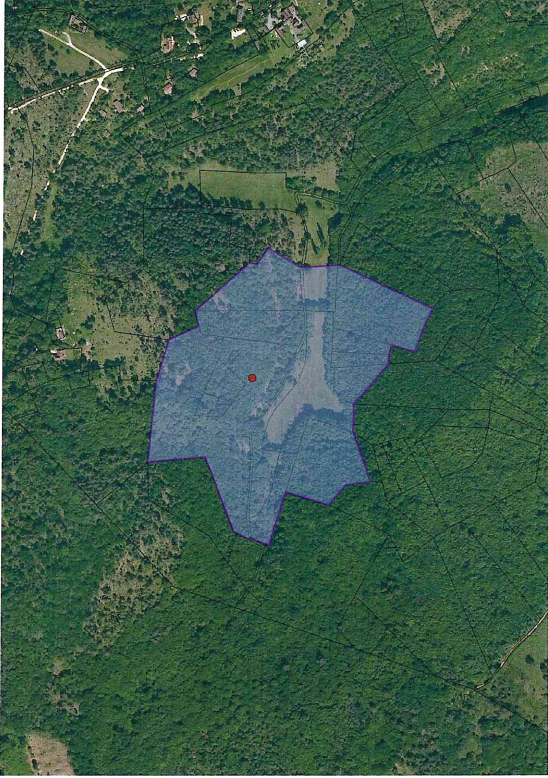
Annexe 1/1 Plan du Périmètre Délimité des Abords du gisement préhistorique du Roc de Barbeau sur la commune de Tursac